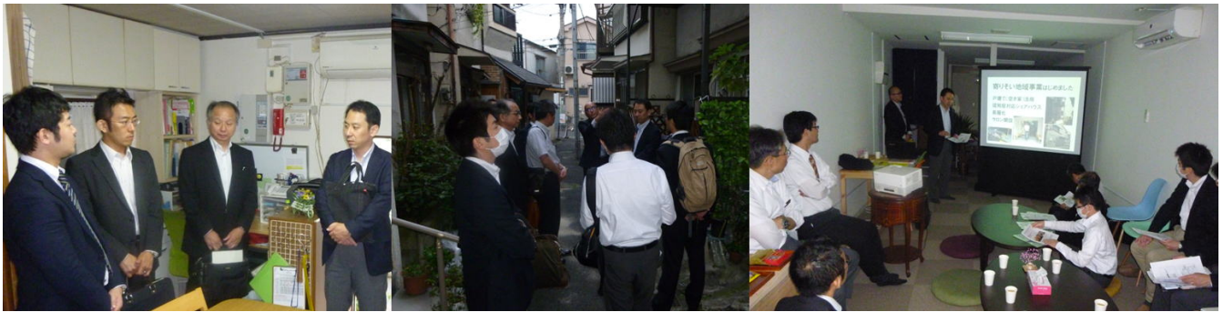
(左) 東駒形荘にて自立援助ホームの事業説明 (中) 京三ハウス前にて京島の路地を案内 (右) えんがわサロン京島にて意見交換