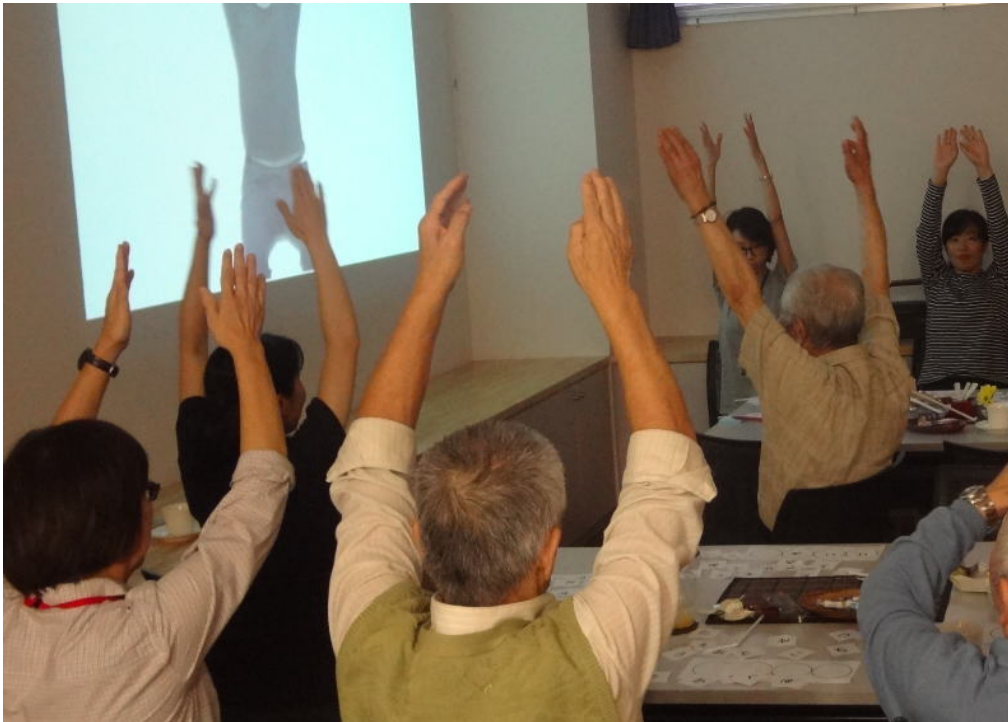
みんなで体操 長生きばんざーい！

6回目の「オレンジカフェ」では、常連さんに加えて新しいお客さんにもたくさんお越しいただきました。とても和気あいあいとして終始リラックスした雰囲気ではじめることができました。